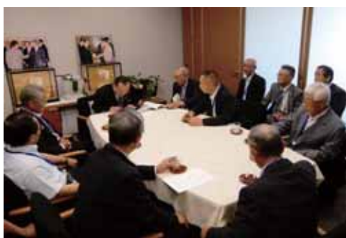
要請書の説明に聞き入る山崎議員

去る6月26日(月)、福井県内の5管内ごとに組織されている農業農村整備事業推進協議会から土地改良区の理事長らが出席し、山崎正昭参議院議員を始め県選出国會議員、並びに進藤金日子参議院議員に対して予算確保に向けた要請活動を行いました。