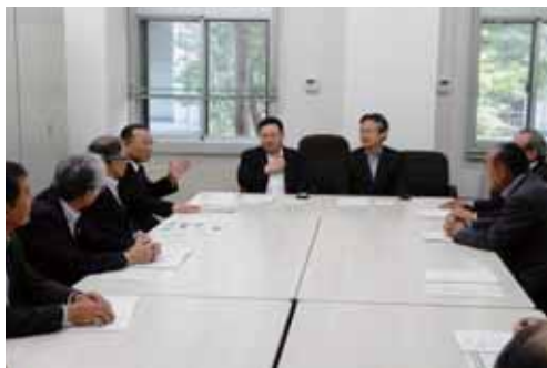
財務省での要請風景

自由民主党二階俊博幹事長への要請では、林幹雄・望月義夫幹事長代理も同席の上、土地改良事業や土地改良区の抱える課題等について直接意見を交わす場も設けていただき、下村博文幹事長代行、細田博之総務会長、茂木敏充政務調査会長へ要請書を持参しました。