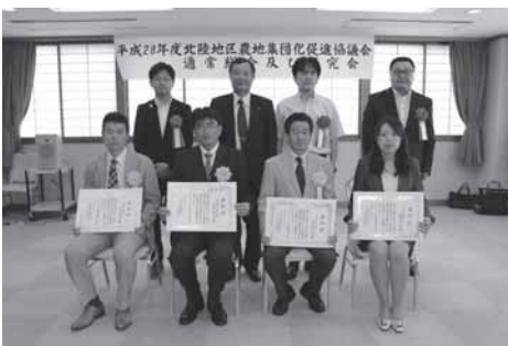
表彰者4名を囲んで

去る6月15日(木)午後2時から、富山県富山市の「いこいの村磯波風」において、北陸四県から22名(県・土地改良区等)の出席のもと、平成28年度北陸地区農地集団化促進協議会通常総会及び研究会が開催されました。