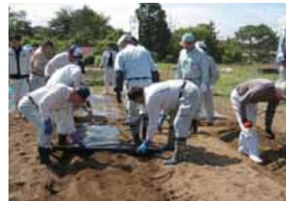
植付準備に励む大人たち

植え方を教わりながら、大人と一緒に2本ずつの苗を植えた子どもたちは、自分の名前が書かれた立札をその間に立てました。今日植えたサツマイモは、秋に収穫する予定です。サツマイモを植え終わると落花生とトウモロコシの苗まで植えていただきました。中には、ご家族で成長具合を確認にくる方もいらっしゃるそうです。この活動は、子どもたちに農業に親しんでもらうだけでなく、農地として維持することで耕作放棄地の解消を目的としています。子どもたちがきっかけとなって、少しでも多くの人に興味をもってもらえるれば嬉しい事です。